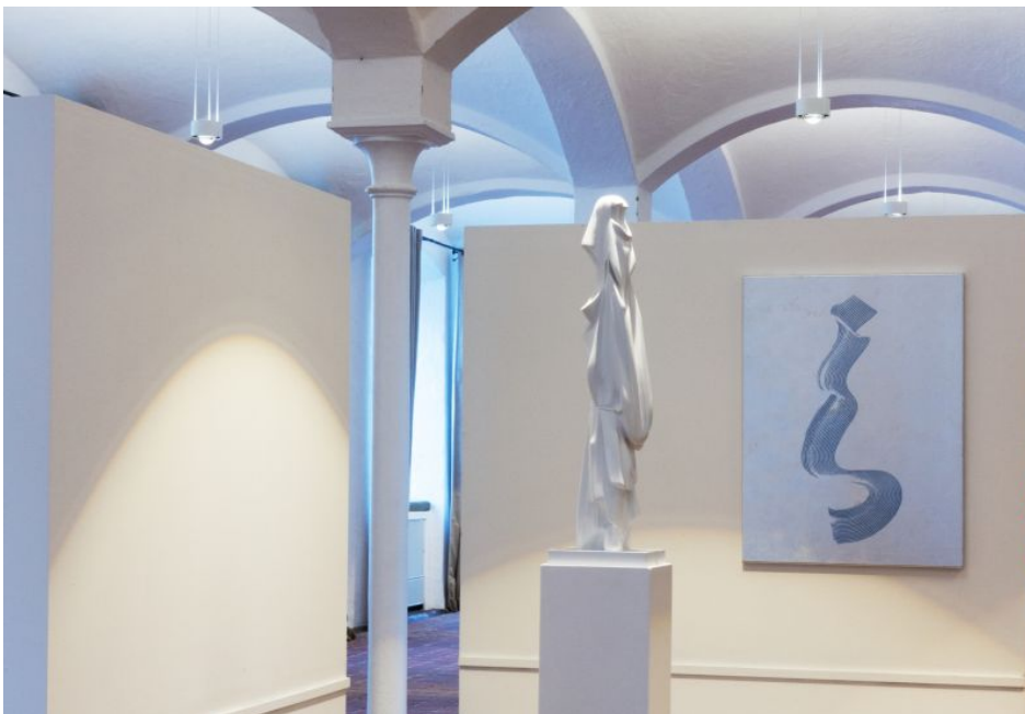
„Campo de`Fiori (Giordano Bruno)“ und „Mirror Painting“. Foto: Philipp Lachenmann

Der gebürtige Münchner und jetzt in Berlin ansässige Künstler Philipp Lachenmann ist nicht nur Architekturmodellbauer und studierter Philosoph, sondern auch ausgebildeter Filmmacher. All das kommt in seinen Werken mit kollektiver Gedächtniskultur zum Ausdruck. In Kaltenbrunn ist er mit zwei Exponaten vertreten.