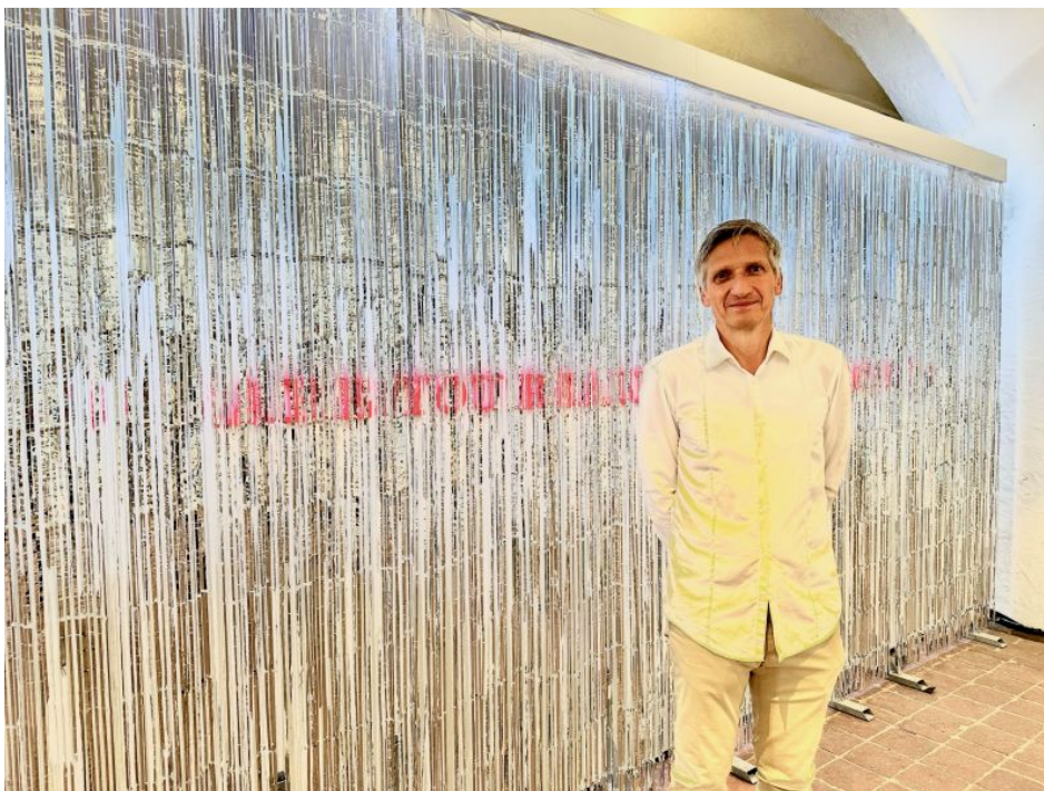
Peter Riss.

Raumgreifend, glitzernd und schillernd erscheint der zweiteilige Lamettavorhang mit dahinterliegender fluoreszierender Schrift von Peter Riss. Magisch und unweigerlich zieht die Installation die Betrachter in den Bann. Der Künstler erklärt dazu: „Es geht mir um die Dualität in der Gesellschaft, um den Hang zur dunklen Seite des Lebens, in der man oft getrieben wird von Gegensätzen und moralischem Besserwissen.“ Und wieder lohnt das genaue Hinschauen und Hinterfragen, das diese Ausstellung so einzigartig macht. Bei Peter Riss geht es um die scheinbar luftig-leichte Welt des Luxus und Reichtums, die er kritisch und im wahrsten Sinne von innen beleuchtet.