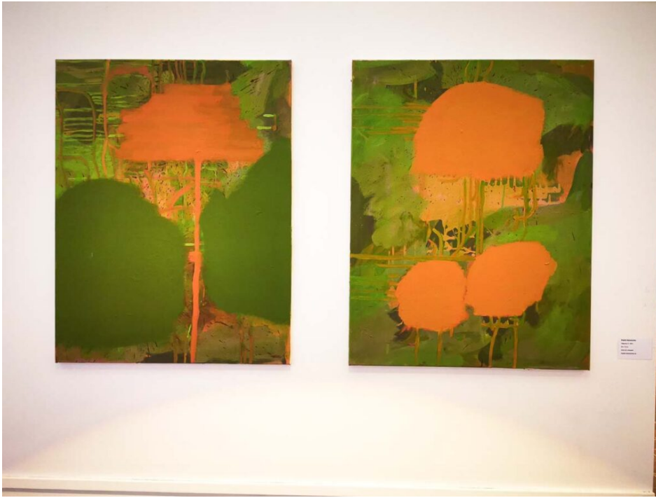
Brigitte Siebeneichler.

Die Gründerin der ausrichtenden Kunststiftung Siebeneichler aus Rottach-Egern will bewusst im Hintergrund bleiben, stellt aber auch aus und lässt die Betrachterin auf die Suche gehen. Bei ihren beiden Bildern spürt man Stimmungen und Emotionen. Gerne übermalt die Künstlerin, bis die Farben zu sich selbst finden und zu einer gestaltenden Leichtigkeit führen. Die Farben sind hell leuchtend gehalten, der Natur nachempfunden und harmonisieren bei der Eröffnung perfekt mit der Kleidung von Brigitte Siebeneichler.