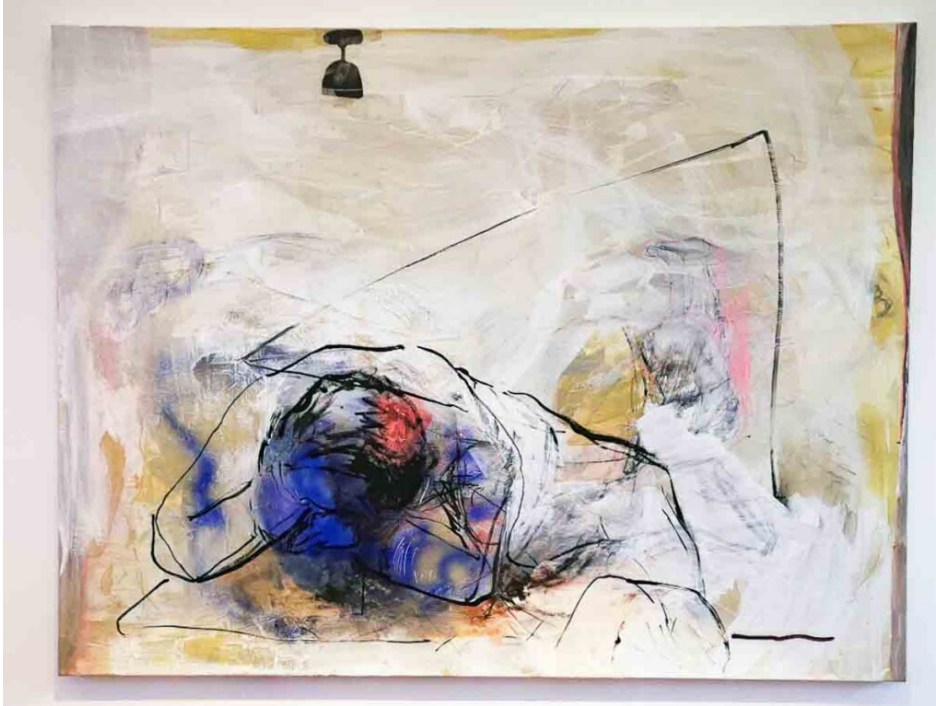
Sybille Rath: „Junger Schlaf“.

Auch Sybille Rath präsentiert zwei bemerkenswerte Objekte: „Junger Schlaf“ von 2023 ist eingebettet und angelehnt an die Malerei Alter Meister. Gefühle wie Angst, Aggression, Verzweiflung treten in Beziehung zur Räumlichkeit. Da flackert, fast nicht zu sehen, ein kleines Lämpchen auf und öffnet den Raum, um dahinter zu schauen. Bei ihrem Bild „Flugrolle“ arbeitet Sybille Rath aus dem Dunkel heraus und entwirft eine Szenerie wie bei Francesco Goya. Aufregend, anregend, mit Sogwirkung durch die Lichtwirkung des Werks. Und plötzlich erkennt man eine durch den Raum purzelnde Figur, die einen gedanklich gefangen nimmt. Die Künstlerin will den Raum zum Betrachten stilllegen und so neues Denken entfachen.