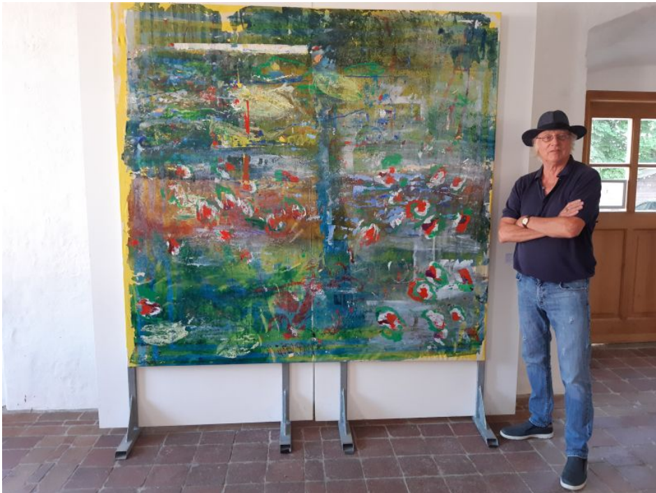
Klaus-Peter Frank: „Seerosen“.

In seinem Atelier in Dürnbach lässt Klaus-Peter Frank kleinformatige Bilder und raumfüllende Exponate entstehen. In